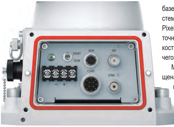
Панель интерфейсов камеры CR-X500

IP55, уверенно предохраняя камеру от воды и пыли. Для дистанционного управления камерой есть последовательный интерфейс, а встроенный очиститель объектива послужит тому, чтобы никакие погодные явления не мешали съемке.