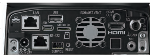
Панели коммутации камер Canon CR-N500 (сверху) и CR-N300

Столь богатый арсенал протоколов позволяет передавать потоковое видео непосредственно в нужную пользователю сеть доставки контента, выбирая всякий раз тот рабочий процесс, который в данных условиях наиболее эффективен. CR-N500 поддерживает гамму Canon Log 3 и режим широкого динамического диапазона Wide DR, давая возможность получать HDR-изображение высокого качества как при прямой трансляции, так и при записи материалов, требующих последующей обработки.