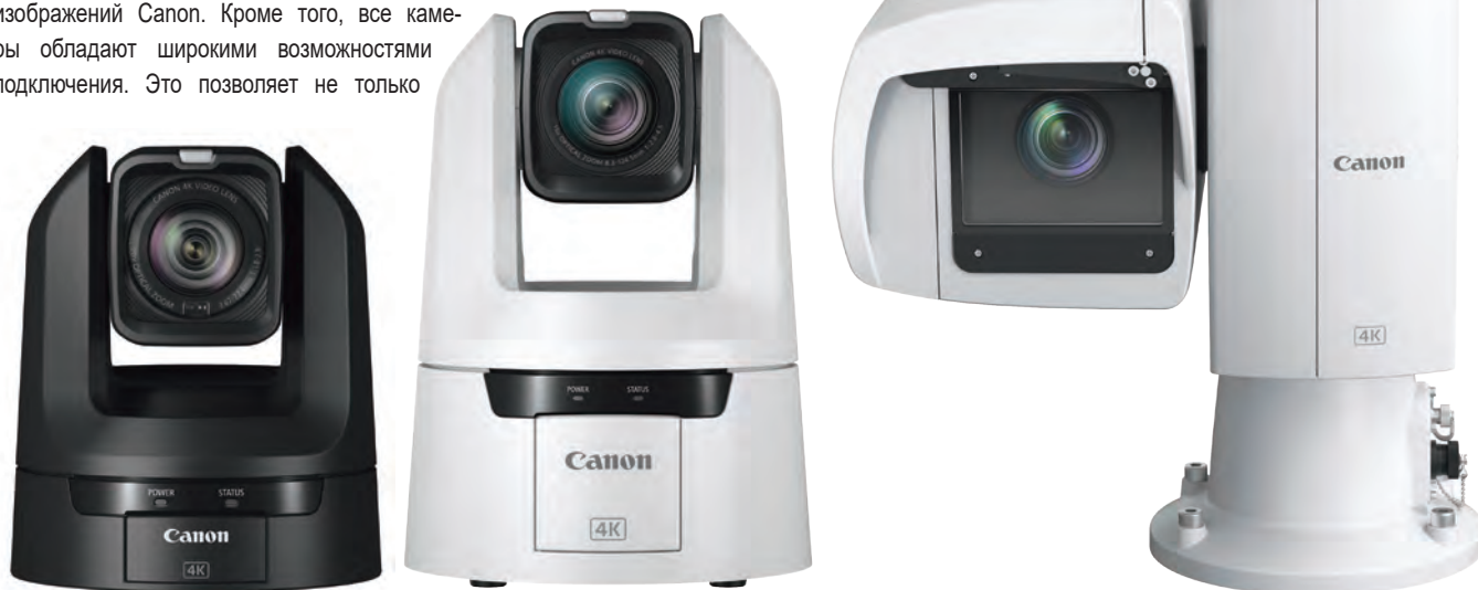
Новые PTZ-камеры Canon (слева направо): CR-N300, CR-N500 и CR-X500

А если съемочной группе приходится работать под открытым небом, то она смело может положиться на CR-X500, поскольку надежный и прочный корпус камеры имеет класс защиты