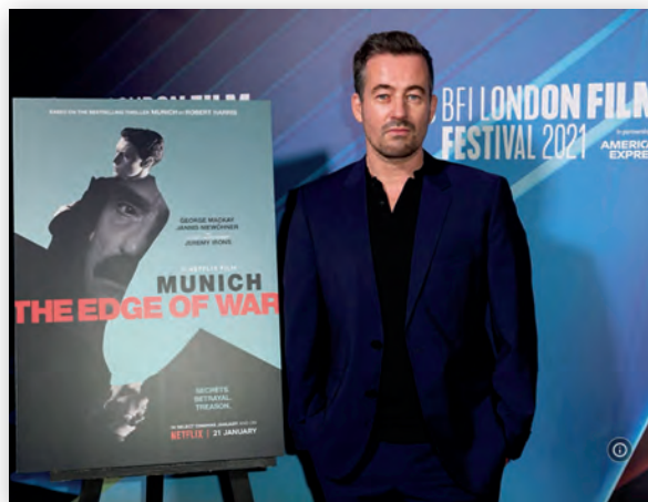
Режиссер фильма «Мюнхен: на пороге войны» Христиан Швохов