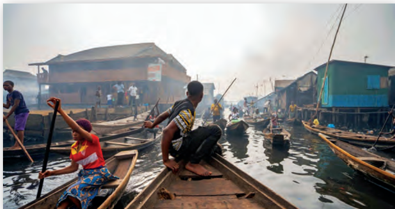
Кадр из фильма «Плот Ноя»

Ну и в конце этого обзора пару слов о заказчиках и дистрибьюторах. Как никогда много картин было создано изначально при участии и финансировании онлайн-платформ Netflix, Apple plus, Disney plus. Нет, кинотеатры не умирают, но сетевая дистрибуция закладывается уже на этапе создания. Жизнь продолжается и нет причин перестать снимать кино. Особенно документальное. ▶