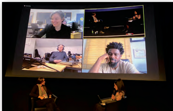
Виртуальная пресс-конференция с режиссером Джоэлом Качи Бенсоном (на экране внизу справа)