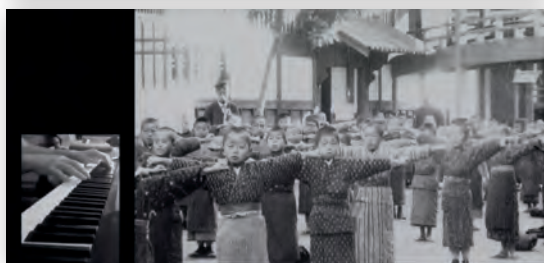
Кадры из документального фильма о Японии 1901...1913 годов

пошло не так» в 2020 году нашего века, и как «поломалась» вся мировая система.