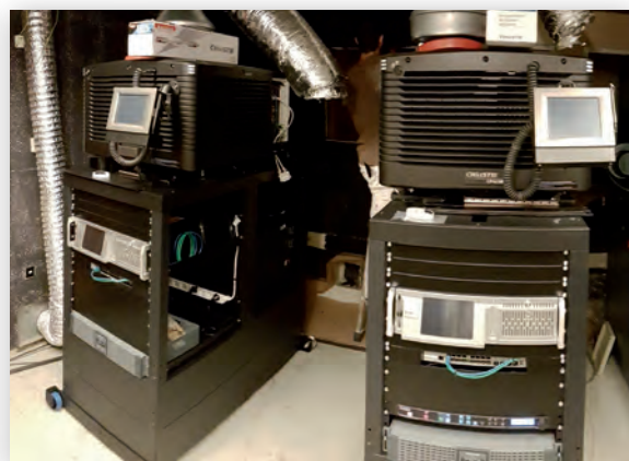
Кинозал «Курсааль» и проекторы Christie, установленные в его аппаратной