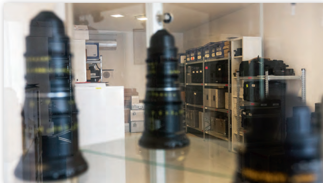
Одно из хранилищ оборудования

Компания «МальтаРент» гордится богатым спектром предлагаемого для аренды оборудования и высоким качеством предоставляемых услуг. Убедиться в этом и подробнее изучить все имеющиеся предложения можно в офисе компании. Там же и оформить сотрудничество. ►