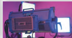
Объективы, камеры, свет — небольшая часть того, что есть в компании