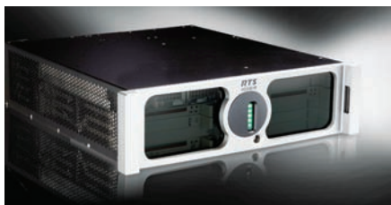
Компактная Intercom-матрица ADAM-M

В дополнение к MADI пользователи теперь могут устанавливать платы AES, RVON и аналоговые, причем с полным резервированием.