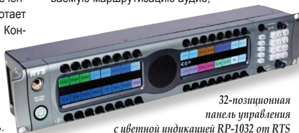
32-позиционная панель управления с цветной индикацией RP-1032 от RTS