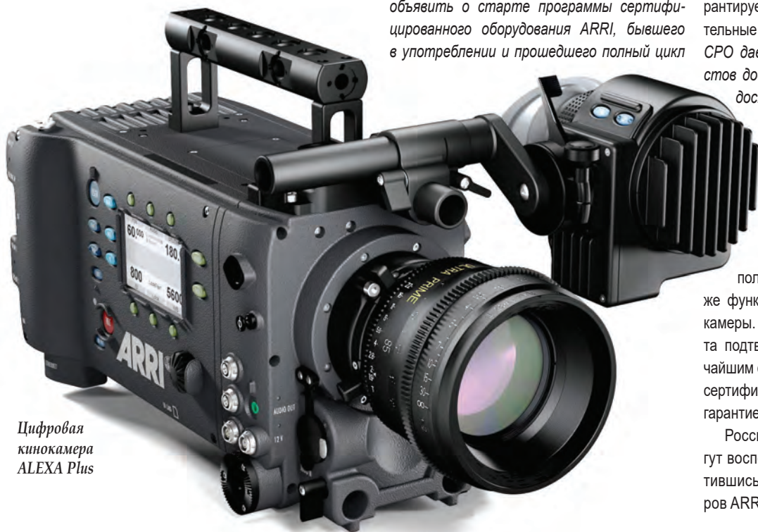
Цифровая кинокамера ALEXA Plus