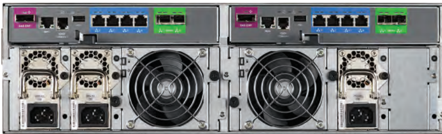
Vess R2600 xiD, вид со стороны задней панели

Режиссер ВГТРК Павел Забелин отметил: «Система Vtrak стала для нас оптимальным решением. Мы собираемся и дальше сотрудничать с Promise, так как вопрос наращивания емкости хранилища данных остается для нас актуальным».