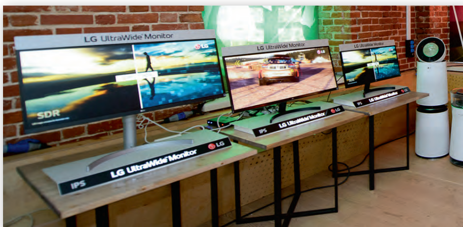
Мониторы серии UltraWide HDR