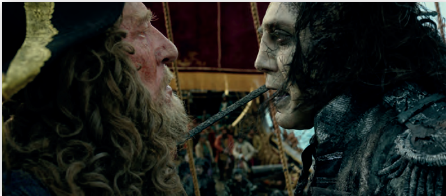
Капитан Барбосса (Джеффри Раш, слева) и капитан Салазар (Хавьер Бардем)

Для сцены с ограблением банка киношники возвели копию банка XVIII века, платфор-