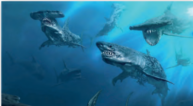
Смоделированные и анимированные на компьютере акулы