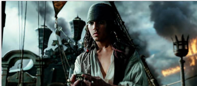
Помолодевший с помощью цифровых технологий Джонни Депп в образе Джека-Воробья

Для создания образа проклятого капитана Салазара актер Хавьер Бардем проводил у гримеров по 2...3 ч ежедневно. А прекрасной Голшифте Фарахани для перевоплощения в таинственную морскую ведьму Шансу требовалось и вовсе 4...5 часов!