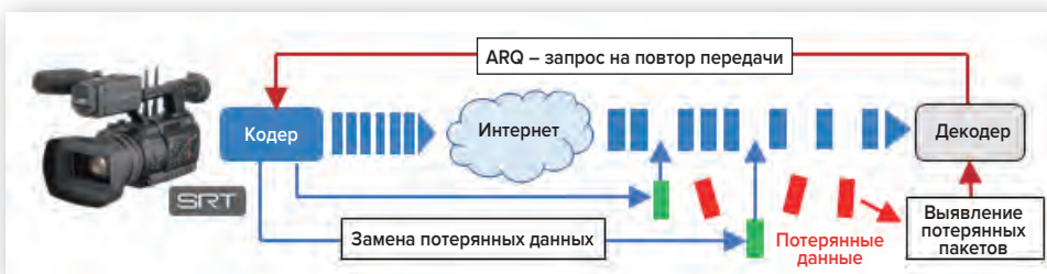
Рис. 2. Компенсация потери данных, задержки и джиттера с помощью протокола SRT