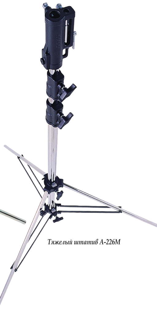
Тяжелый штатив A-226M