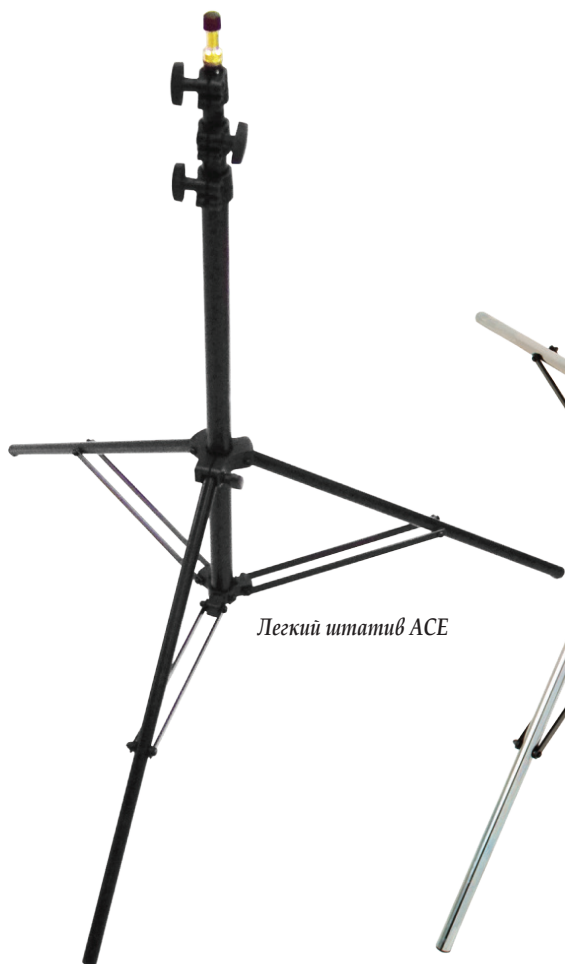
Легкий штатив ACE

Для осветительных приборов нагрузочная способность штатива является, пожалуй, определяющей в выборе. Она зависит от материала, из которого изготовлен штатив, качества изготовления креплений и шарниров, конструкции штатива. Для большин-