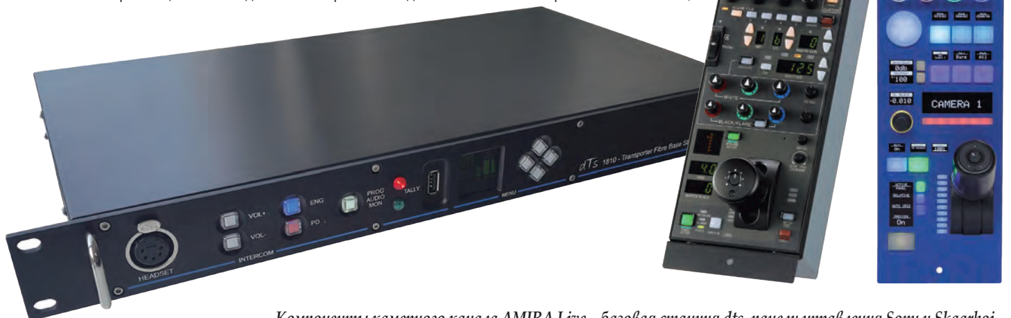
Компоненты камерного канала AMIRA Live – базовая станция dts, панели управления Sony и Skaarhoj

В завершение нужно отметить, что появление AMIRA Live не отправляет на пенсию классическую AMIRA. Обе модели актуальны, а пользователи получили выбор – кому нужна системная (студийная) камера, тому адресована AMIRA Live, а кто заинтересован в более универсальной модели, обладающей функционалом видеокамеры вне студии и студийной камеры, для того оптимальной станет AMIRA, так же совместимая с камерным каналом dts, с двумя RCP, SUP 6.1 и со студийным видеискателем VMM-1.