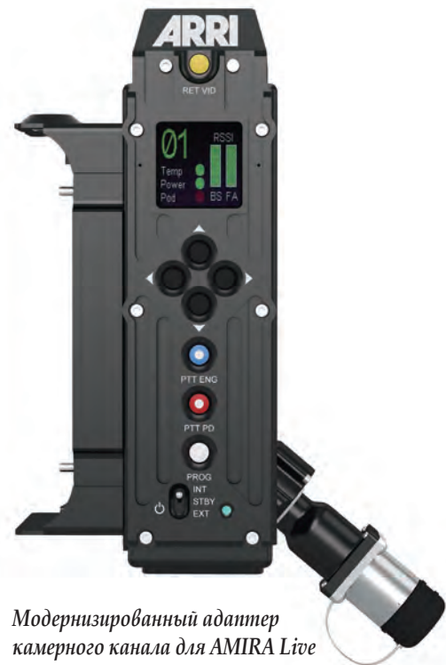
Модернизированный адаптер камерного канала для AMIRA Live

Но даже с наступлением цифровой эпохи кино- и телекамеры шли каждой своей дорогой. Телекамерам не хватало киношного стиля, а кинокамерам – интеграции с телевизионными технологическими комплексами. Ситуация изменилась с появлением ARRI AMIRA, которую стало можно подключать к тракту камерного канала. С этого момента появилась возможность при любой многокамерной телевизионной трансляции получать изображение не просто высокого технического качества, а именно в кинематографическом стиле.