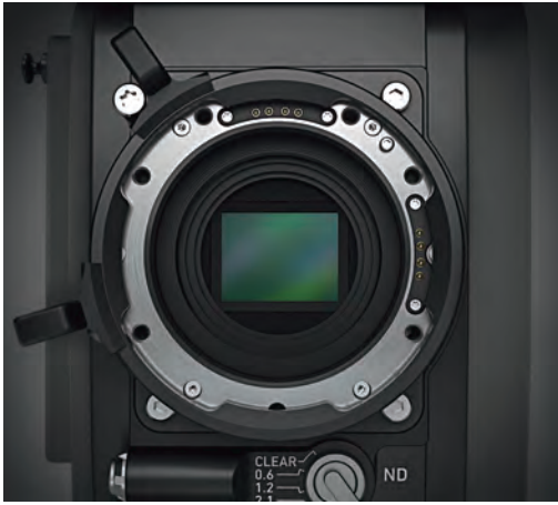
AMIRA Live – тот же сенсор, что и в ALEXA

мерой можно использовать весь богатейший спектр оптики, доступной и для кинокамер, и для теле-/видеокамер (с байонетом B4). Это не преувеличение. AMIRA Live может оснащаться байонетами PL (Hirose 12 pin и LDS + LBUS), B4, EF и LPL. Кроме того, есть адаптеры B4 на PL и PL на LPL, позволяющие расширить ассортимент совместимых объективов без замены штатного байонета камеры.