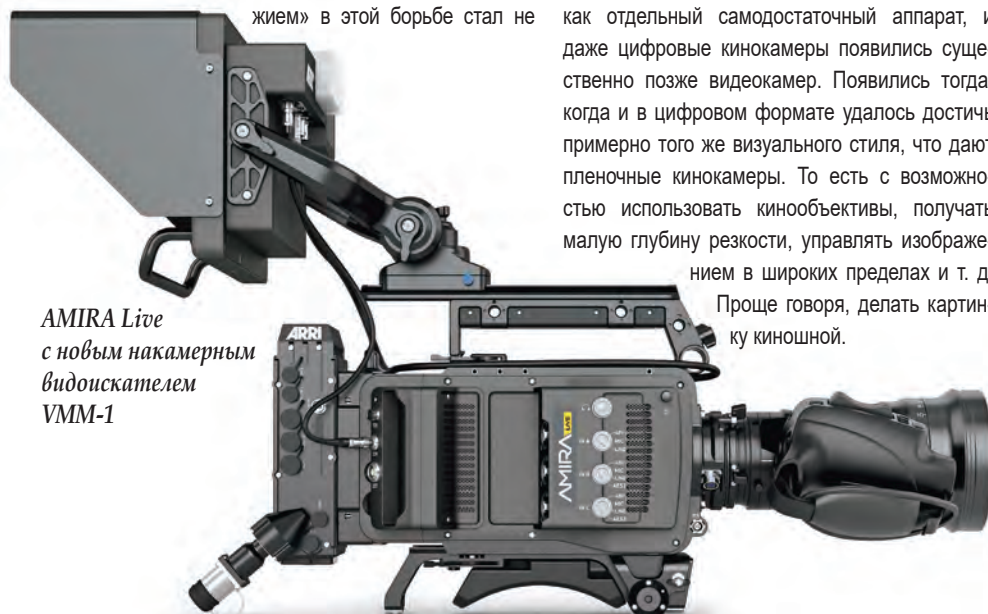
AMIRA Live с новым накамерным видеоискателем VMM-1

Как съемочный аппарат, AMIRA Live осталась цифровой кинокамерой. Изображение в ней формируется датчиком ARRI ALEV III Super 35, то есть тем же, что во всех камерах ALEXA, кроме полнокадровой ALEXA LF. Это значит, во-первых, что изображение, снимаемое на AMIRA Live, не просто имеет кинематографический визуальный стиль, а изначально является кинематографическим. Во-вторых, с этой ка-