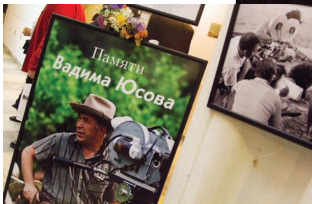
Экспозиция в фойе, посвященная памяти Вадима Юсова