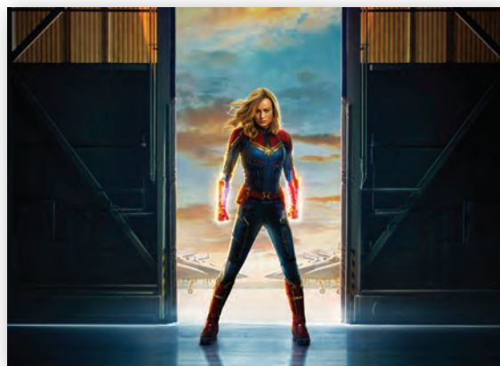
Бри Ларсон в образе Капитана Марвел