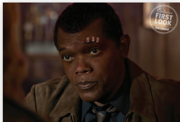
Омоложенный Сэмюэль Л. Джексон

У нас было много справочных фото- и видеоматериалов, чтобы изучить, как эти актеры выглядели в 1995 году, понять, какие перемены произошли в их внешности с тех пор, и что нужно сделать, чтобы визуально вернуть им молодость. Процесс омоложения – это в буквальном смысле покadroвая техника, настоящее искусство. Несколько художников многие месяцы просидели за компьютерами, доводя их внешность до совершенства, но одновременно надо было сле-