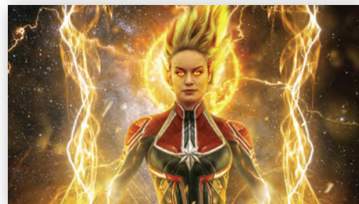
Костюмы и визуальные эффекты в фильме

ров и съемочной группы. Грим и костюм помогли ему очень быстро найти суть своего персонажа».