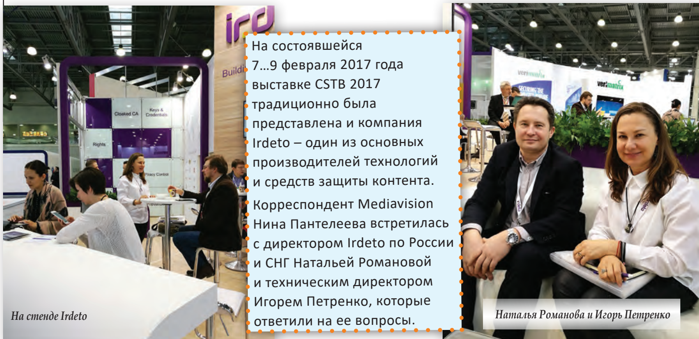
На стенде Irdeto

Интервью с руководством компании Irdeto по России и СНГ