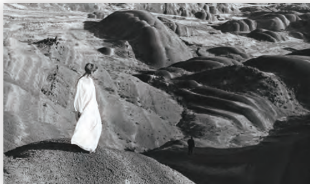
Кадры из фильма «Мольба»